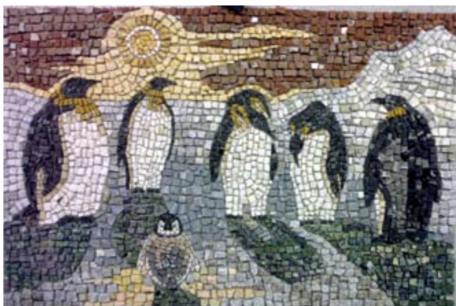
Penguins, mosaic 45 x 75 cm Пингвини, мозаик 45 x 75