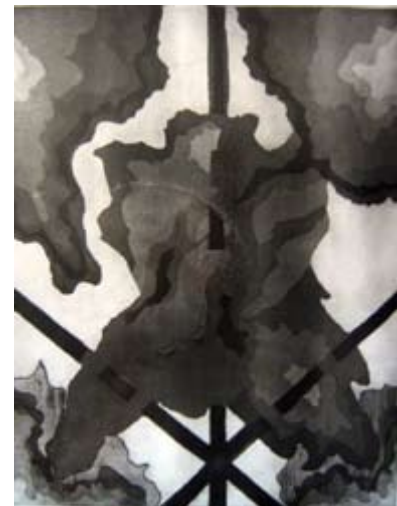
Making Love, aquatint 100 x 70 cm Водење љубов, акватинта 100 x 70