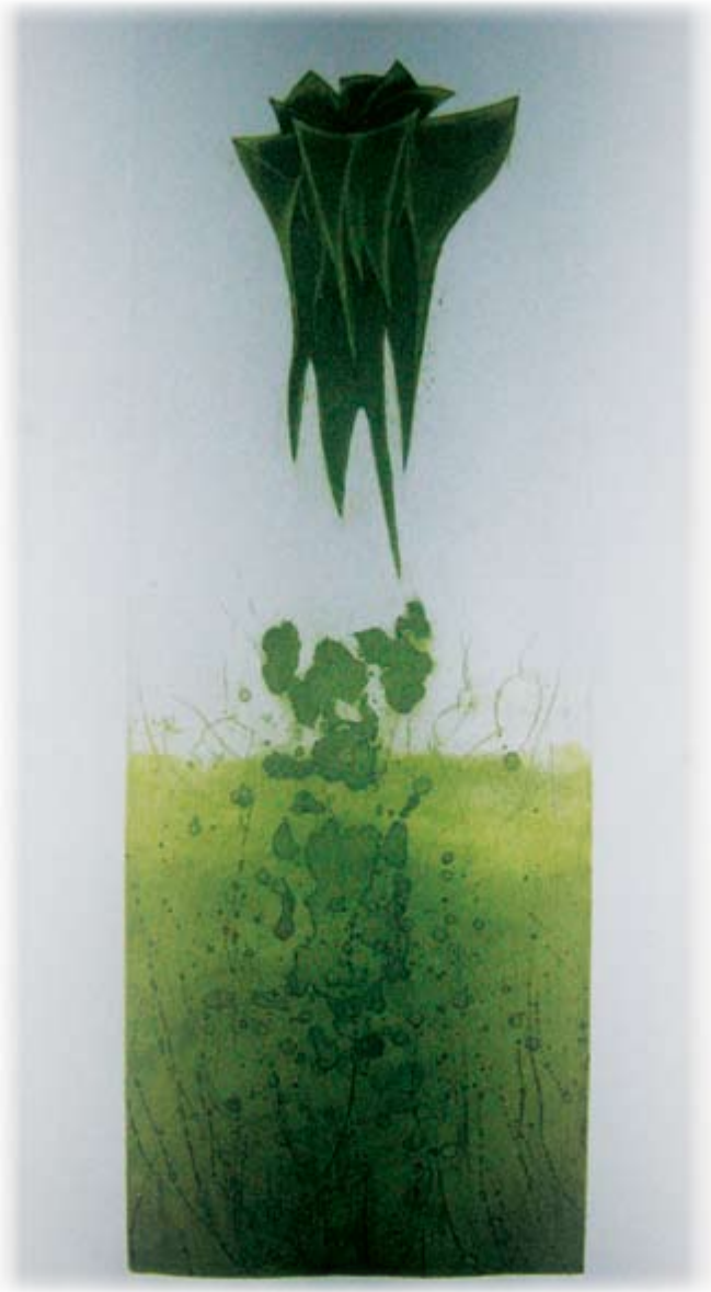
Relief, aquatint 70 x 35 cm Ослободување, акватинта 70 x 35