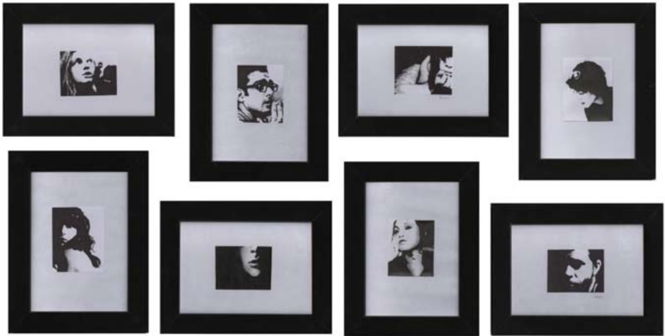
Stories, ink and pencil on paper (polyptych of 8 pieces) 25 x 18 cm