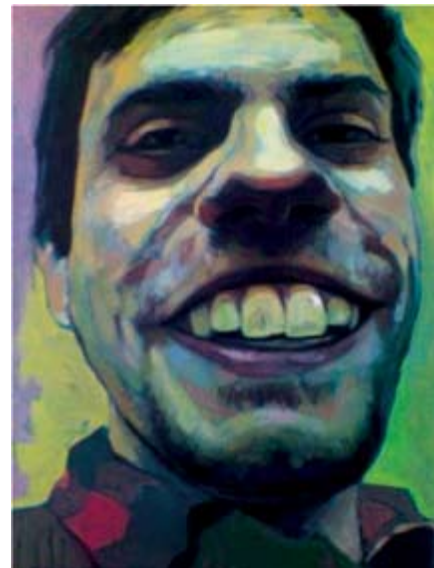
Mickey, oil on cardboard 80 x 60 cm Мики, масло на картон 80 x 60