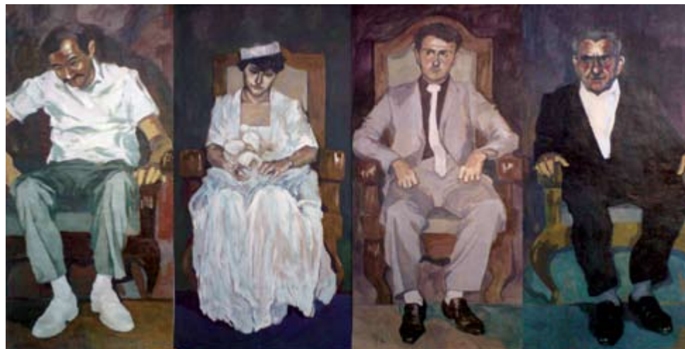
Wedding day 2, oil on recycled paper, polyptych 100 x 250 cm Свадба 2, масло на рециклирана хартија, полиптих 100 x 250