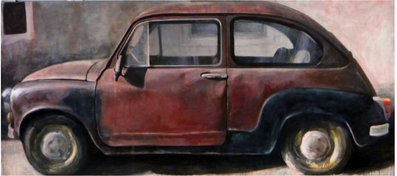
Zastava-Flag, oil on canvas 150 x 320 cm