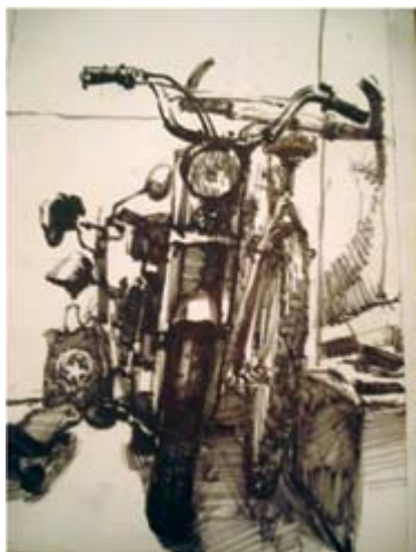
Tomos Motorcycle, marker on paper 31 x 20 cm Томос мотор, маркер на хартија 31 x 20