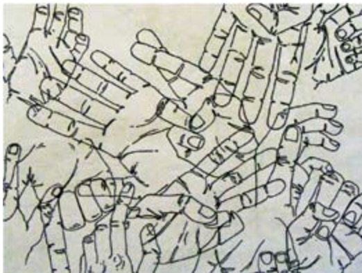
Signs, ink on paper 20 x 31 cm Знаци, туш на хартија 20 x 31