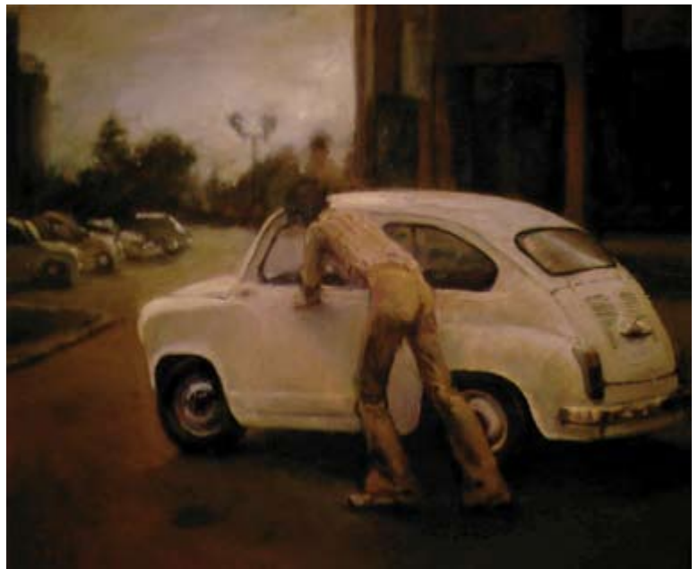
Viva Yugoslavia, oil on canvas 100 x 120 cm Живела Југославија, масло на платно 100 x 120