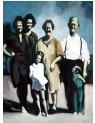
Eastern family, oil on canvas 120 x 60 cm Источна фамилија, масло на платно 120 x 60