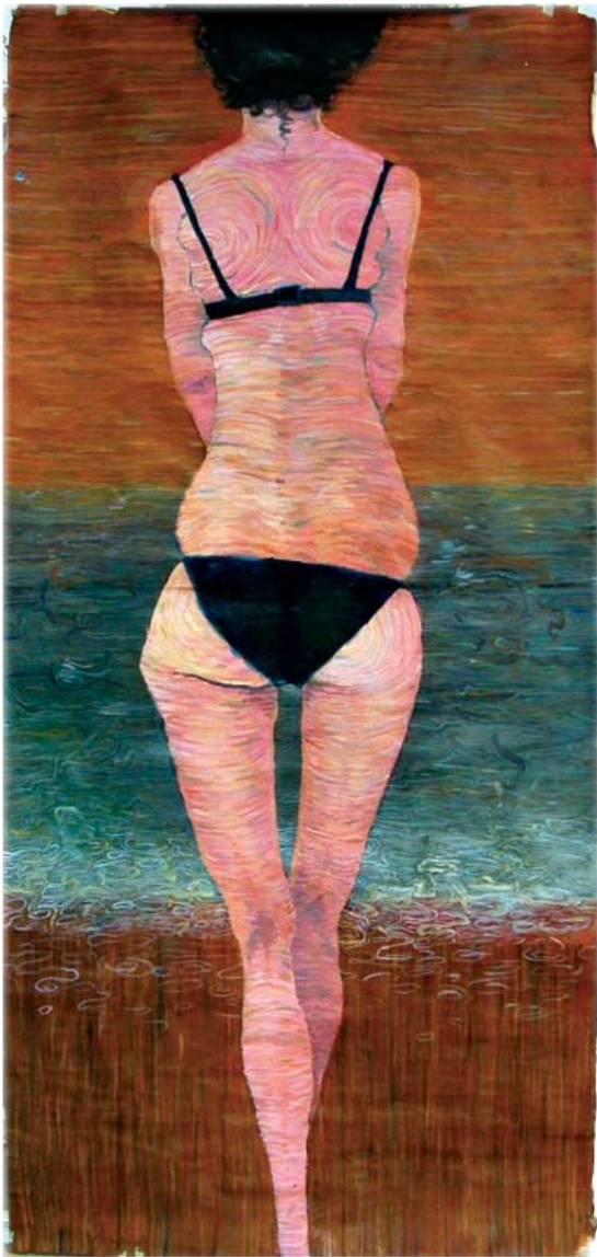
Crème brûlée, oil on recycled paper 230 x 100 cm Crème brûlée, масло на рециклирана хартија 230 x 100