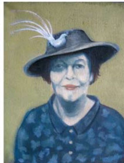
Небраска, масло на платно, триптих 125 x 240