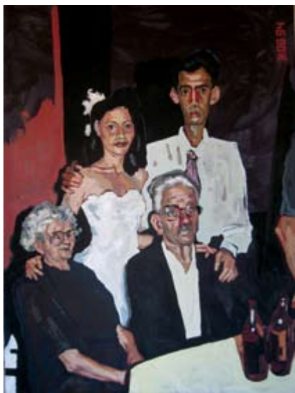
Wedding day 1, oil on recycled paper 250 x 100 cm Свадба 1, масло на рециклирана хартија 250 x 100