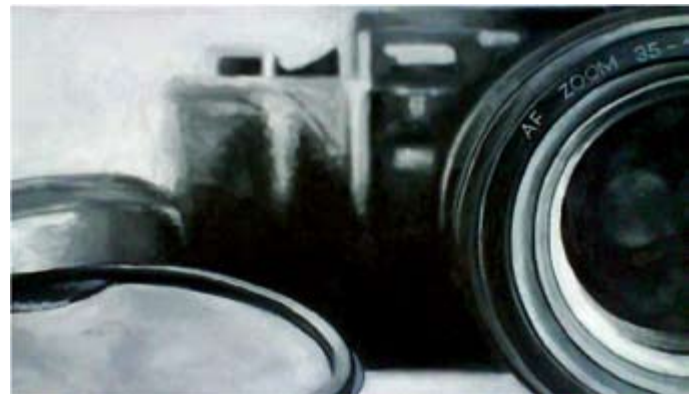
Macro, oil on canvas 40 x 70 cm Макро, масло на платно 40 x 70