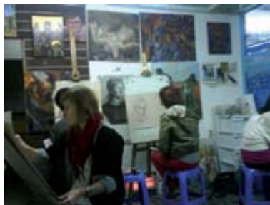
НВО Арт Студио