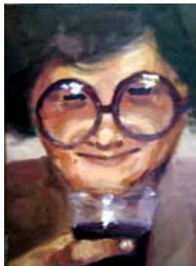
Man with glasses, oil on canvas 39 x 29 cm Човек со очила, масло на платно 39 x 29