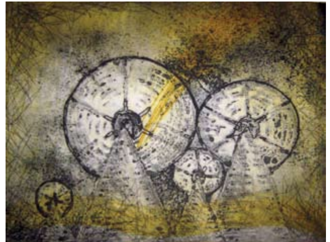
Windmill, aquatint 65 x 75 cm Ветерница, акватинта 65 x 75