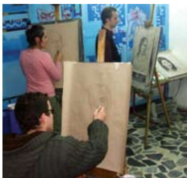
Bakehouse Art Complex