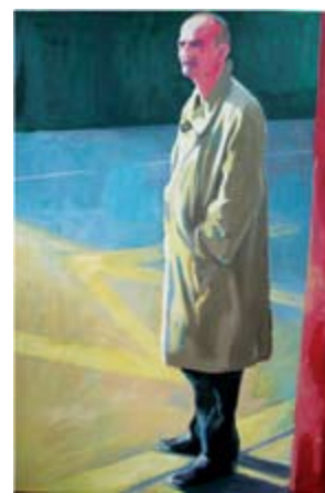
Strange man on the street, oil on recycled paper 200 x 160 cm Странец на улица, масло на рециклирана хартија 200 x 160