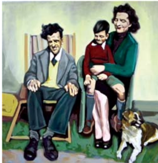
Western family, oil on canvas 100 x 100 cm Западна фамилија, масло на платно 100 x 100