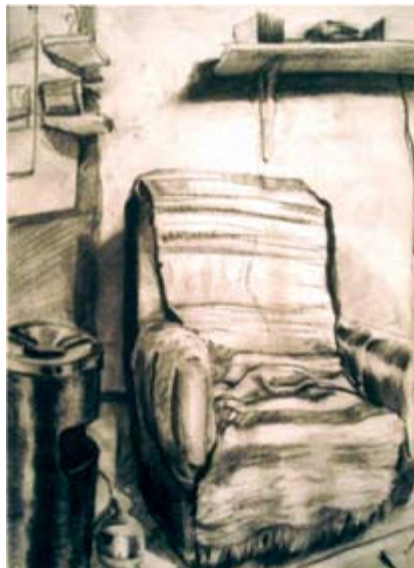
Chill out place 1, charcoal on recycled paper 100 x 70 cm Чилаут место 1, јаглен на рециклирана хартија 100 x 70