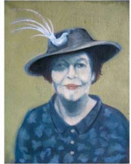
Небраска, масло на платно, триптих 125 x 240